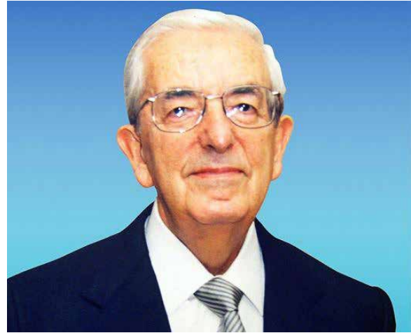
Figura 4. Imagen de Manuel Cruz emérito. Disponible en: https://www.aeped.es/noticias/despedita-manuel-cruz-herandez-maestro-destacado-pediatria-espanola .

Fue una figura incansable en dar conferencias, excepto durante el duelo de su mujer, que duró varios meses, y quizá los dos últimos años de su vida; teniendo en cuenta el parón de conferencias presenciales por la pandemia COVID en sus diversas olas desde marzo de 2020. Dio conferencias