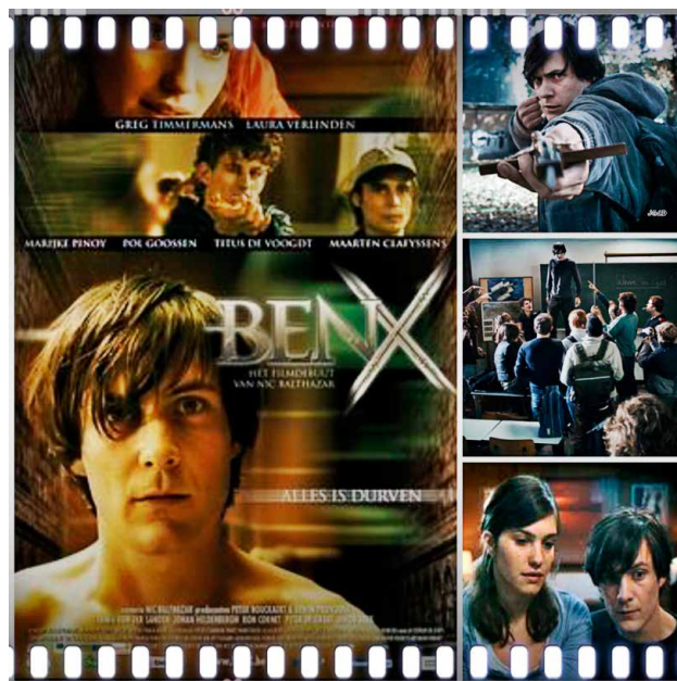
Prescripción 3. Ben X (Nic Balthazar, 2007).

Y las películas de culto frecuentemente se asocian con la polémica y por alguno (o los dos) motivos siguientes: por incluir ideas o temas notablemente controvertidos o por presentarlo de un modo alejado de los convencionalismos estéticos o narrativos. ¿Y por qué es cine de culto Mater amatísima ? Al menos por los siguientes elementos: por su osadía formal y temática, por su lejanía del cine convencional y por su condición de cine maldito español. Una manera especial de aproximarse al autismo en una película estrenada hace más de cuatro décadas.