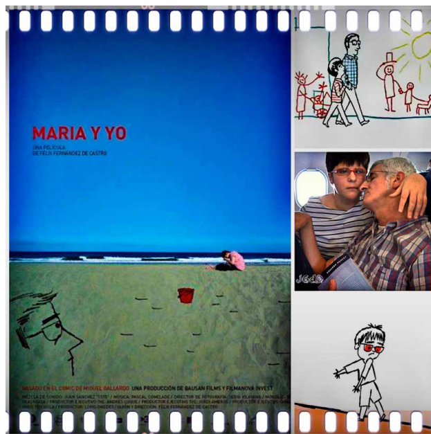
Prescripción 5. María y yo (Félix Fernández de Castro, 2010).