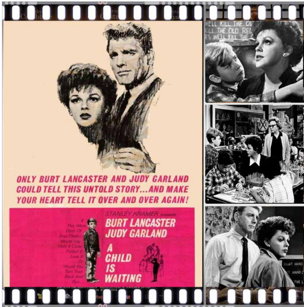
Prescripción 1. Ángeles sin paraíso (John Cassavetes, 1963).

Siete películas argumentales desde el séptimo arte para adentrarnos con sentido y sensibilidad, con ciencia y conciencia, en el mundo de las personas con TEA, y donde deseamos que cada vez se refleje más su realidad y menos otros mitos.