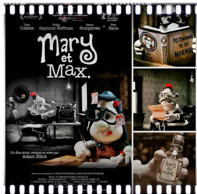
Prescripción 4. Mary and Max (Adam Elliot, 2009).

Mary Daisy Dinkle es una niña de 8 años que vive en Melbourne (Australia) con su familia: un abuelo que sigue bañándose en agua helada para sentirse vivo; un padre que trabaja en una fábrica de té y pasa más tiempo con sus animales disecados que con su hija; y una madre con un alma complicada y con afición por el tabaco, el cricket y el jerez, y que siempre le dice a Mary que era un “accidente”. Mary adoraba los dibujos animados de los Noblets, su color favorito es el marrón y su