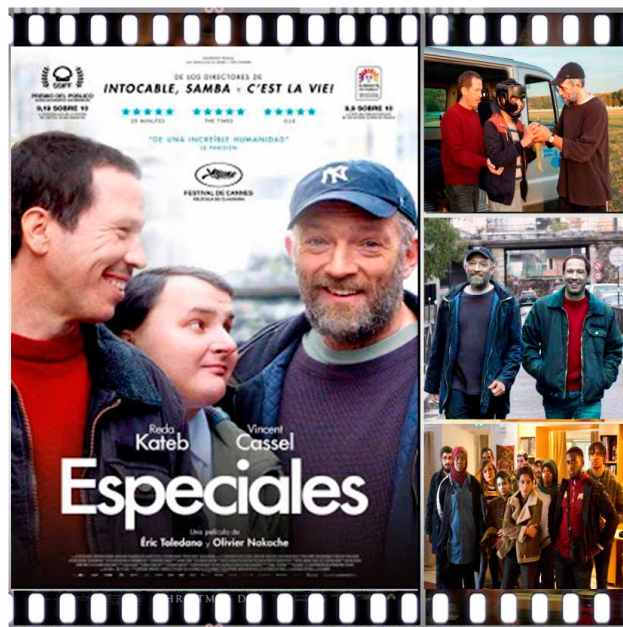
Prescripción 7. Especiales (Olivier Nakache y Eric Toledano, 2019).

Ser espectadores de una realidad dura, la del dilema de qué hacer con aquellas personas con autismo grave (u otras pato-