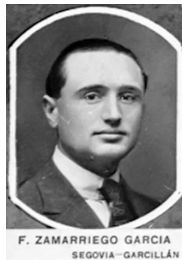
Figura 1. Foto de su orla de licenciatura. A la derecha, fragmento central de la orla, con algunos profesores.

El tema de su tesis doctoral fue: "Consideraciones acerca de meningitis en la infancia, especialmente sobre el trata-