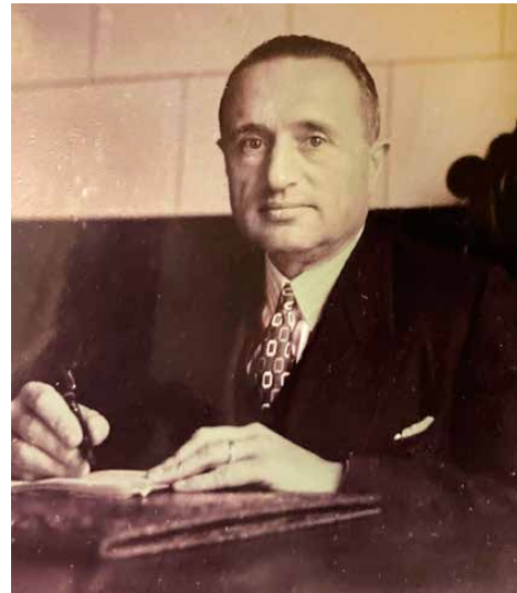
Figura 2. Foto en escritorio. Década de los años 40.

Desde el VI Congreso nacional de Pediatría, de Santander, julio de 1944, “numerosos pediatras consideraron llegado el momento de agruparse corporativamente para mejorar el nivel sanitario de la población infantil y reanudar los contactos y reuniones científicas de carácter nacional e internacional”. No había habido congreso nacional desde Granada, en 1933. Cavengt fue el Presidente efectivo del VI Congreso Nacio-