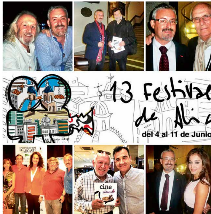
Figura 1. Cine y Pediatría en diferentes Festivales de Cine.

ha convertido en un proyecto colectivo gracias a Internet y a las redes sociales. Experiencias en congresos científicos de pediatría (nacionales e internacionales), experiencias en actividades docentes (de grado, máster, doctorado y formación continuada), experiencias en publicaciones científicas (pediátricas y no pediátricas) y, cómo no, también nos hemos hecho presentes en diversos Festivales de cine, donde hemos vivido momentos "de cine" (Fig. 1).