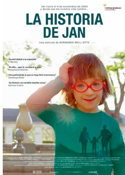
Figura 5. La historia de Jan (Bernardo Moll Otto, 2016).

4. Prescribir la película española La historia de Jan (Bernardo Moll Otto, 2016) (4) para acercarnos al entrañable mundo del síndrome de Down (Fig. 5).