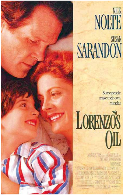
Figura 2. El aceite de la vida ( Lorenzo's Oil , George Miller, 1992).