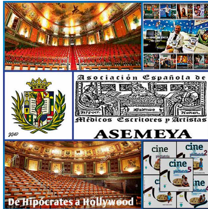
Figura 7. Cine y Pediatría en la Asociación Española de Médicos Escritores y Artistas (ASEMEYA).

Bienvenidos a la sección “Terapia cinematográfica en la infancia y adolescencia” de la revista Pediatría Integral. Películas de todos los continentes, en muchos idiomas y desde todas las edades pediátricas, sobre temas médicos y sociales que afectan a la infancia y ado-