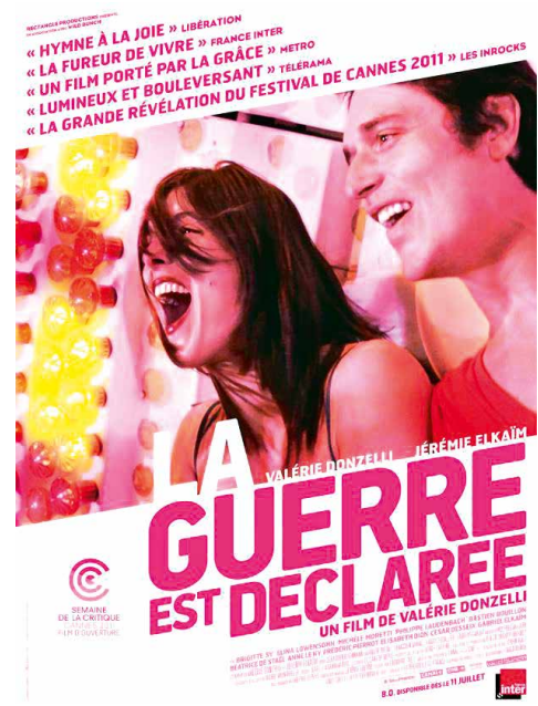
Figura 4. Declaración de guerra ( La guerre est déclarée , Valérie Donzelli, 2011).