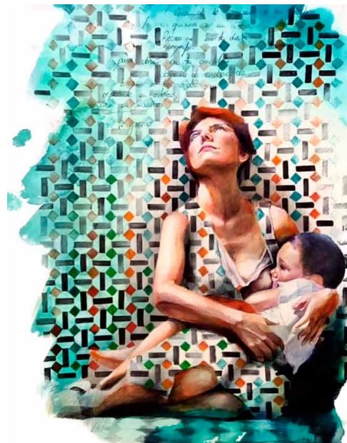
Figura 6. Maternidad.

invitan al comentario. En efecto, la madre está sentada en el suelo, mirando hacia lo alto, como si mostrase alguna indiferencia ante el hecho de estar alimentando a su hijo. Su cabeza está magistralmente trazada y pintada, a pesar de que se muestra en un escorzo ciertamente pronunciado. El cuello, algo engrosado, las clavículas, los brazos, las manos y las piernas, están muy bien pintados. El pecho izquierdo sobresale del vestido para ofrecérselo al pequeño. Va cubierta con un vestido con figuras geométricas y de color, al igual que el mosaico o la pintura que decora el fondo del cuadro. En este caso, parece que el vestido de la mujer es una continuidad de la pared.