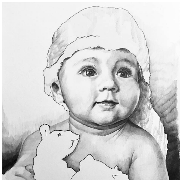
Figura 2. Marisol.

En el dibujo Hola papá , nos representa, probablemente, a la esposa y un hijo del pintor. Excelente composición que