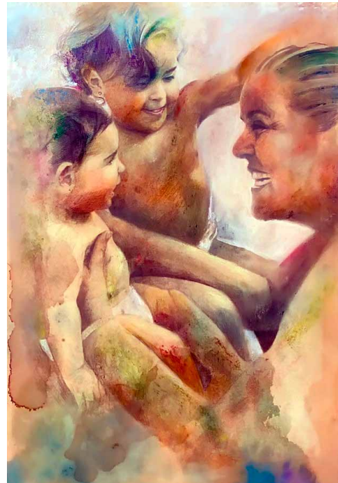
Figura 5. En la piscina.

El pintor nos invita a ver una escena un tanto surrealista: se trata de una Maternidad , con una madre que está dando el pecho a un niño. Son varios los detalles de esta obra que