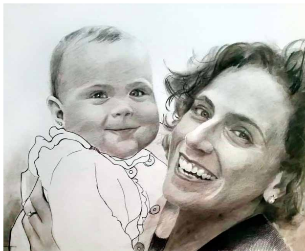
Figura 3. Hola papá.

muestra a una mujer que mantiene a su hijo en brazos. De la mujer, solo aparece la cabeza, el cuello y una mano, representados con detalles casi fotográficos y muy bien proporcionados. El pelo perfectamente dibujado, con trazos finos y gruesos, cejas bien perfiladas, nariz y pabellones auriculares normales: lleva un pendiente en la oreja izquierda y un aro en el dedo anular de su mano izquierda. Los labios son finos y la boca, abierta, nos permite ver las características de los dientes, de ambas arcadas. Las incipientes arrugas aparecen, como es normal, en los párpados inferiores y la región perioral.