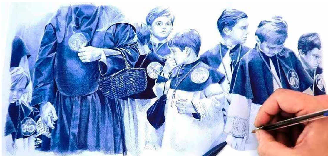
Figura 7. Los pequeños cofrades.

dante y moreno, la frente despejada y los detalles de la cara, compatibles con un niño de edad preescolar. Está tomando el pecho y se muestra algo triste. En la obra pueden apreciarse las piernas y los pies del chiquillo. Martín Mena nos ha querido transmitir, además, un mensaje indescifrable escrito en la parte superior de la pared del fondo, todavía con algunos caracteres legibles. La luz se recibe desde la izquierda y los colores son fríos, sobre todo, verdes y azules con contrastes algo violentos. Se trata de una acuarela y bolígrafo sobre papel. Mide 32 por 50 cm, fechada en 2019 (Fig. 6).