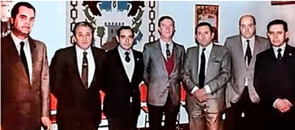
Figura 2. Primera Junta Directiva de la SEPEAP (1984). Momentos fundacionales de la Sociedad de Pediatría Extrahospitalaria.