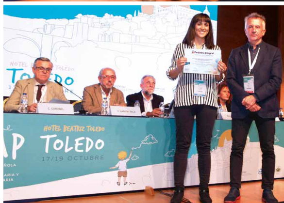
Premio a la mejor imagen.