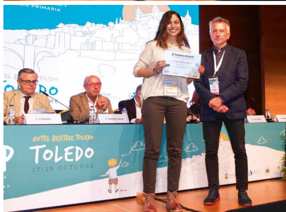
2º Premio Caso Clínico.