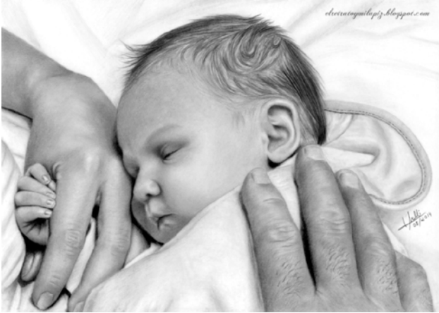
Figura 4. Nexo de unión.

Pelo rizado como corresponde a su etnia, una frente despejada, grandes ojos y nariz achatada. Se aprecia cierto grado de obesidad en la niña, que se advierte muy bien en la mano y en la muñeca derecha. Fondo blanco. Como en casi todas las obras de Morelli, se ha incorporado la firma de la autora. Data de 2013, se ha realizado con lápiz sobre papel y mide 30 por 40 cm. Pertenece a una colección particular (Fig. 3).