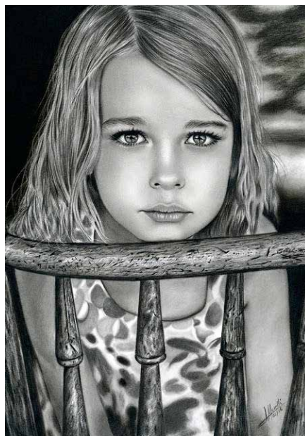
Figura 8. Un atisbo de esperanza.

Azlina está inspirada en una fotografía original de Yaman Ibrahim. Se observa a una niña de unos cuatro años de edad que mira al artista directamente. Es un retrato realista en tres cuartos. La niña está en actitud serena y expectante. Sus facciones son delicadas y lleva una melena larga de pelo moreno. Se viste con un vestido de manga corta. Da la sensación de que pertenece a una clase menesterosa de algún país de oriente próximo o del norte de África. Emplea colores fríos, fundamentalmente: azules, marrones y negros. El fondo es de un llamativo azul. Data de 2015, mide 40 por 30 cm, realizada con pastel sobre papel y es propiedad del autor (Fig. 7).