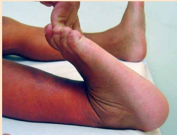
Figura 2. Hiperlaxitud articular.