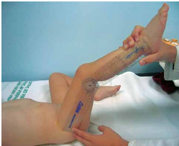
Figura 5. Medida del ángulo poplíteo con goniómetro.

neos. La presencia de rigidez, tanto vertebral como periférica es, casi siempre, signo de patología importante.