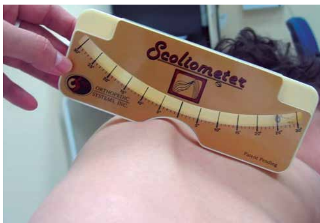
Figura 6. Gibosidad toracolumbar izquierda de 25° medida con escoliómetro de Bunnell, en niña con parálisis cerebral de tipo tetraparesia espático-distónica.

normal entre 20 y 40) (19) . Para terminar, se explora el plano frontal (asimetrías, eje occípito-interglúteo, test de Adams en bipedestación, sedestación y prono). La realización del test de Adams en bipedestación (en niños mayores de 5 años o colaboradores) debe realizarse de forma rigurosa. El paciente debe colocarse con los pies paralelos y separados 10-15 cm y el médico debe colocarse detrás y ordenar al niño que vaya agachándose despacio. Debe observarse si la región vertebral está paralela al suelo (escasa flexión: región cervical o cervico-torácica, flexión intermedia: región torácica y flexión máxima: región lumbar). La vista puede detectar salientes laterales (gibas) superiores o 1-2°, lo que quiere decir que si visualmente no apreciamos diferencias, podemos establecer que el test es negativo; si hay una gibosidad, debe ser medida con el escoliómetro (Fig. 6), recomendándose la realización de una telerradiografía pósterio-anterior y lateral de la columna vertebral en bipe, si se superan los 5°. En caso de dolor vertebral, se realizará una palpación segmentaria y reiterada de las apófisis espinosas, ligamento interespinoso, articulares posteriores y musculatura paravertebral; se practicarán las maniobras sacroilíacas (compresión frontal y de espina ilíaca antero-superior; compresión posterior del sacro) y los signos de posible afectación medular y/o radicular.