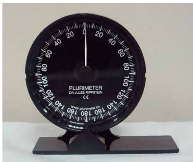
Figura 1. Inclinómetro mecánico ( plurimeter Dr. Rippstein ).

deformidades aisladas (pie zambo) o en el contexto de una enfermedad previa (osteochondrodisplasias, parálisis cerebral) y malformaciones congénitas.