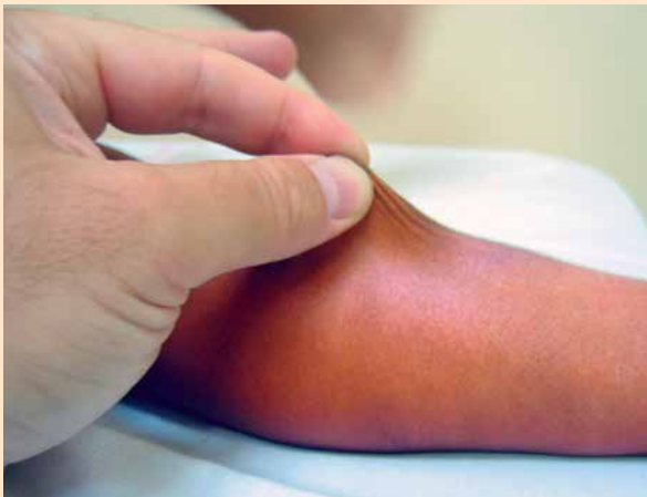
Figura 1. Hiperelasticidad cutánea.

A los cuatro años y dos meses, se observa pie plano-valgo bilateral reductible con radiografía patológica (Fig. 3), por lo que se añade al tratamiento, la utilización de ortesis plantar.