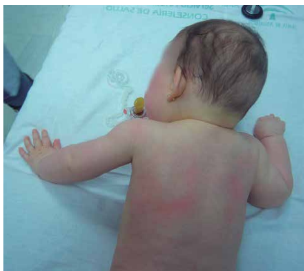
Figura 4. Movilidad espontánea asimétrica (puño cerrado derecho) en una lactante con hemiparesia.

A nivel axial, hay que descartar la presencia de una deformidad vertebral, sobre todo, en niños con: retraso motor, hipotonía, malformaciones viscerales o determinados síndromes pediátricos (escoliosis, que se detecta mediante el test de Adams en sedestación o cifosis lumbar que se valora con el lactante en prono, característica de la acondroplasia), y de tortícolis muscular (nódulo en el músculo ECM que suele aparecer alrededor del mes y luego va disminuyendo de tamaño, limitación de la rotación cervical ipsilateral, limitación de la lateralización contralateral y asimetría facial característica). La presencia de vellosidad localizada