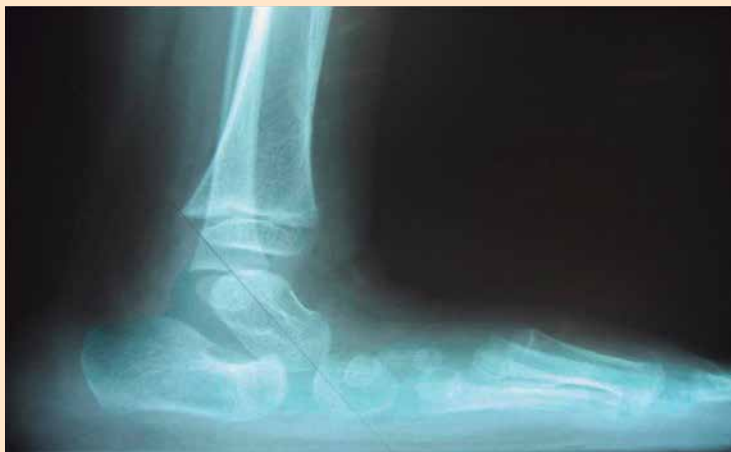
Figura 3. Pie plano secundario. Verticalización del astrágalo con hundimiento del arco longitudinal.