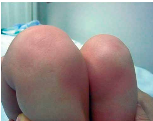
Figura 2. Signo de Galeazzi positivo izquierdo en una lactante de 3 meses con displasia del desarrollo de la cadera izquierda.