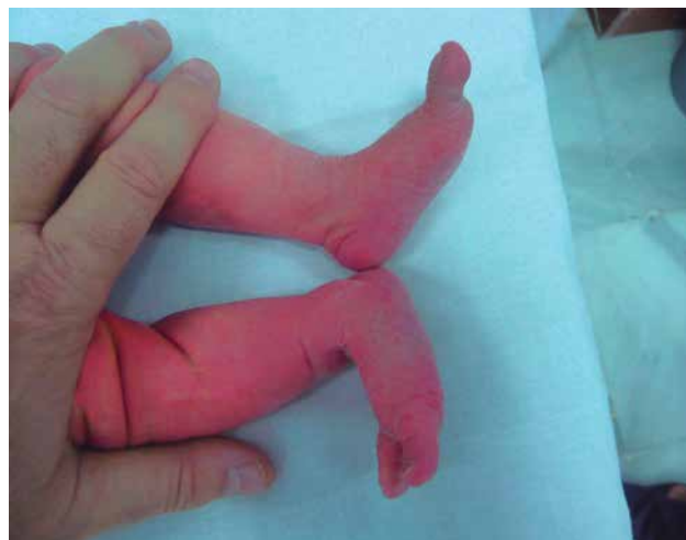
Figura 3. Astrágalo vertical derecho: convexidad característica de la planta del pie.

trada) y Ortolani (que reduce la cadera luxada), la existencia de un muslo aparentemente más corto mediante la maniobra de Allis o Galeazzi (Fig. 2), el ascenso del fémur luxado ( signo de Klisic : se localiza el trocánter mayor y la espina ilíaca ántero-superior; en la cadera normal, la línea que une estos puntos apunta al ombligo y en la luxada pasa por debajo), la ausencia de flexo fisiológico en la cadera luxada y la sensación de pistonaje e inestabilidad al realizar presión axial con la cadera en flexión de 90° y aducción neutra (12) (Tabla II).