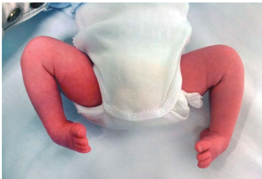
Figura 3. Recién nacido que presenta un pie equino varo congénito bilateral. Véase las deformidades en equino, varo y supinación de los pies.

gico, que habitualmente se retrasa hasta los 2 años de vida.