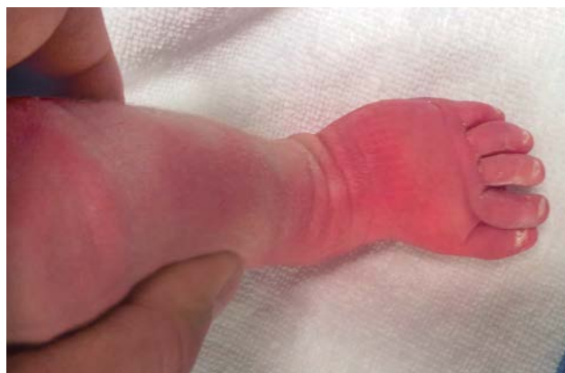
Figura 2. Imagen clínica de un lactante que presenta la deformidad de un metatarso varo congénito, donde se puede observar la angulación del medio pie en su zona interna. En esa localización, la piel sufre un pliegue dérmico muy pronunciado.

Los pies más rígidos necesitarán yesos seriados en las primeras semanas de vida, aprovechando la laxitud ligamentaria de los neonatos. Raramente, será necesario el tratamiento quirúr-