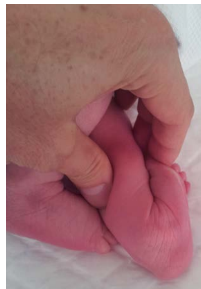
Figura 4. Deformidad en un recién nacido con pie talo valgo intenso, donde el dorso del pie puede contactar fácilmente, con la parte anterior de la pierna.

En algunas ocasiones, puede llegar a diagnosticarse previo al nacimiento, gracias a los estudios ultrasonográficos, llegando a presentarse en 1 de cada 10.000 nacidos vivos, sin predilección