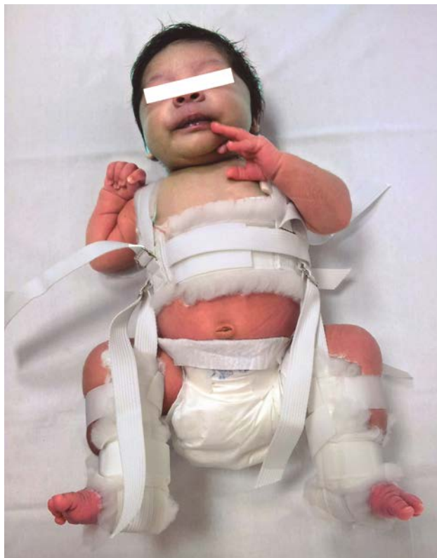
Figura 5. Arnés de Pavlick en un lactante con displasia de cadera. Véase que el arnés está colocado sobre la piel, para sujetar de forma más eficiente la reducción de la cadera. Los cuidadores no deben retirar el arnés de ninguna forma.

El tratamiento consiste en la reducción de la cadera mediante un sistema de flexoabducción llamado arnés de Pavlik (Fig. 5). Este arnés coloca