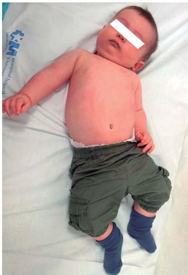
Figura 7. Lactante que presenta una deformidad en C, también llamado niño moldeado. Nótese el tronco curvo, la inclinación de la cabeza y la aducción de la extremidad, que está por encima del nivel corporal.